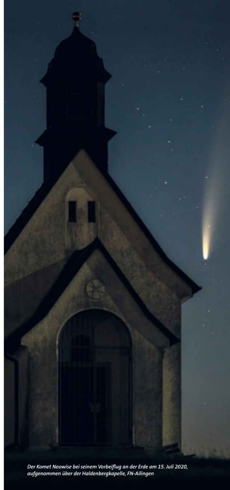
Der Komet Neowise bei seinem Vorbeiflug an der Erde am 15. Juli 2020, aufgenommen über der Haldenbergkapelle, FN-Ailingen