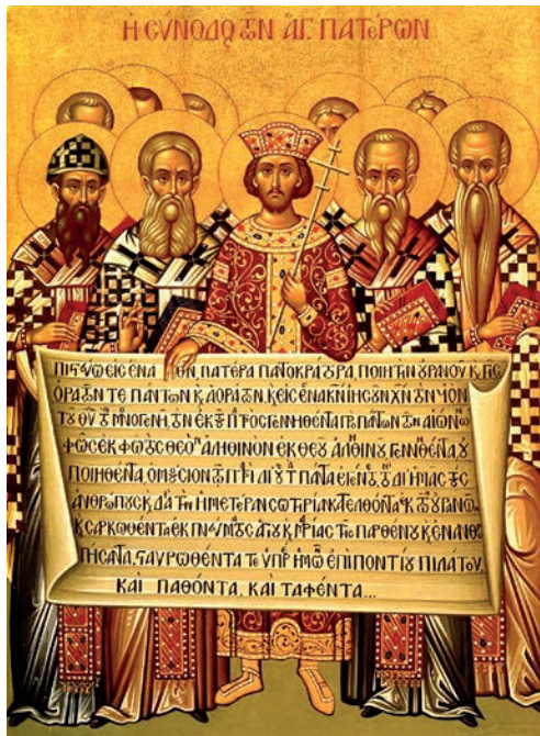
Erstes Konzil von Nizäa (325): Kaiser Konstantin entrollt den Text des Nicäno-Konstantinopolitanum.